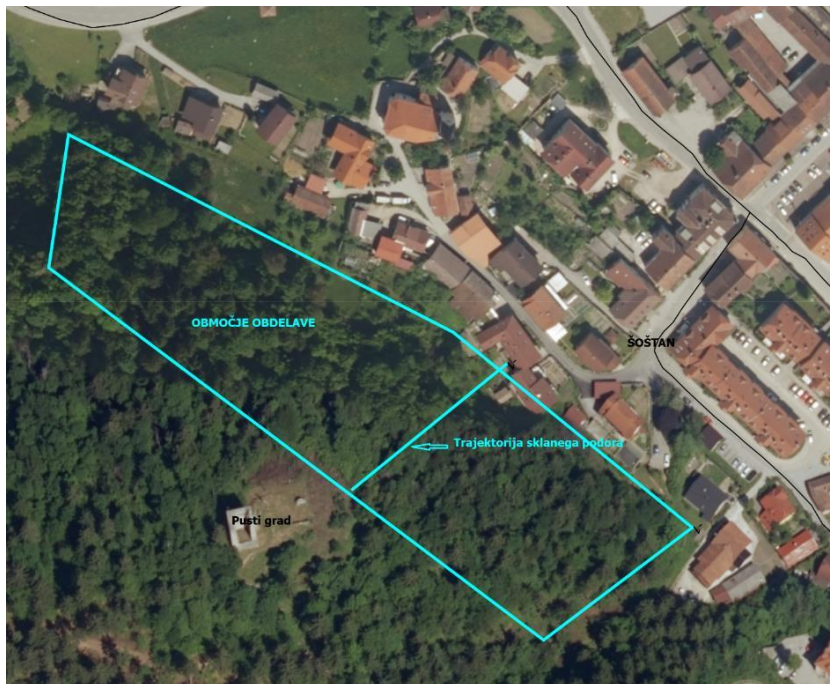
Slika 1: Situacija območja potencialnih žarišč skalnih podorov (območje obdelave)

Območje obdelave se višinsko nahaja med koto ca. 370 m.n.v. (objekti ob Partizanski poti) do ruševin Pustega gradu na koti ca. 450 m.n.v in nad zahodnim delom območja do vrha hriba na koti cca. 497 m.n.v, širna območja pa znaša ca. 250 m. Območje obdelave je prikazano na sliki 1.